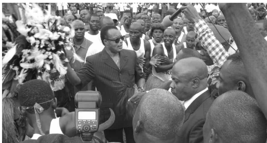
Denis Sassou N'Guesso au milieu des danseurs d'Ékongo

Quand le son du tam-tam se mélange au croassement d'instruments taillés dans des bambous de Chine sur lesquels le joueur gratte une tige rigide, et quand le chant est entonné, les têtes commencent à bouger, puis les reins, puis tout le corps. En général, le danseur agit torse nu, mettant toute son énergie à baisser et à relever la tête. Un