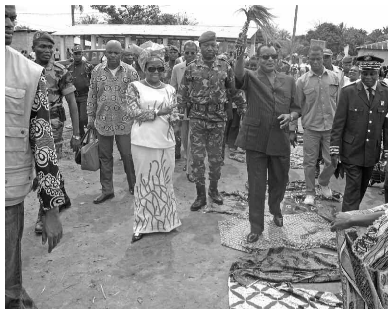
Le chef de l'État et son épouse accueillis par les habitants de Bokouélé

Rappelons que le bâtiment qui abrite le dispensaire de